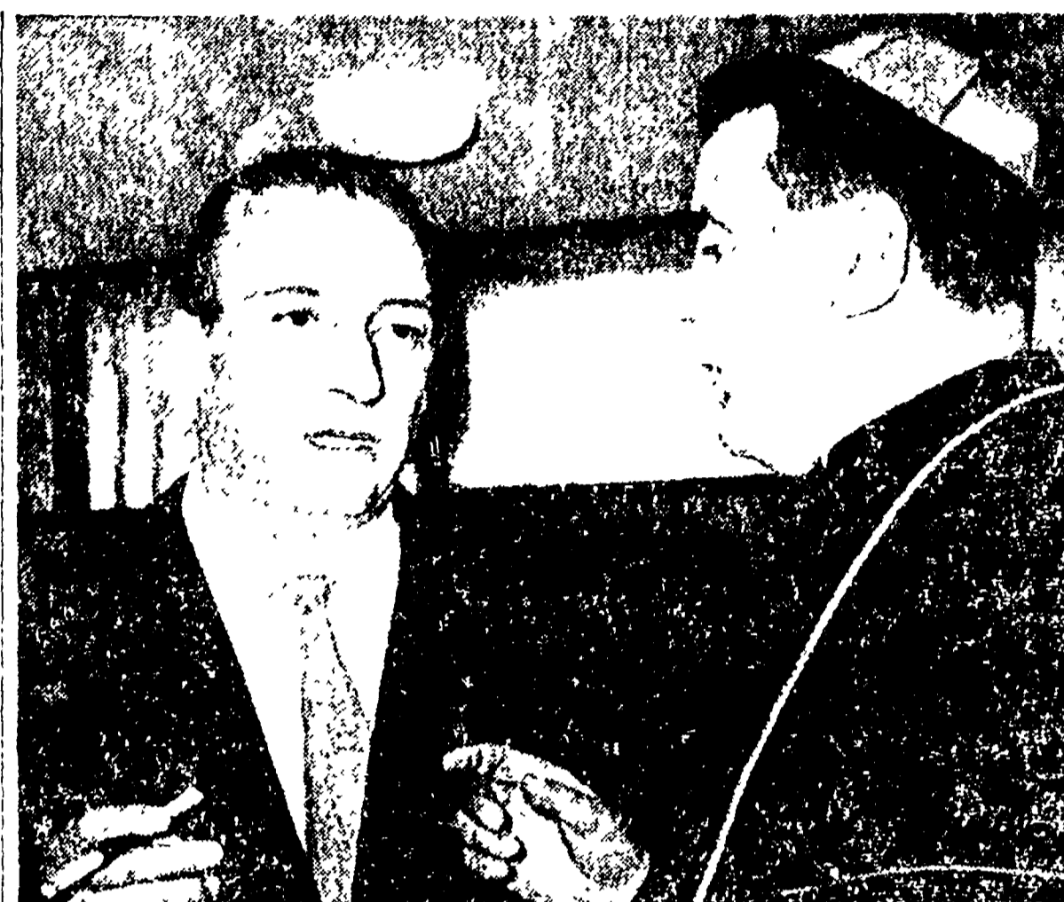
Per completare la biografia di ZAULI bisogna riferire che il neo commissario straordinario della federazione calcistica italiana è stato nominato dal C.O.N.I. Nella foto Zauli con il presidente della federazione, il dottor Barassi.

Il comunicato diramato al Foro Italoico - Non esclusa una collaborazione di Saini - Zauli parte per Stoccolma Il dottor Zauli, segretario generale del C.O.N.I., è stato nominato commissario straordinario della Federazione calcistica italiana. La giunta esecutiva del C.O.N.I. ha deciso di affidare la gestione della federazione al dottor Zauli, che ha dato un'immagine di serietà e di competenza.