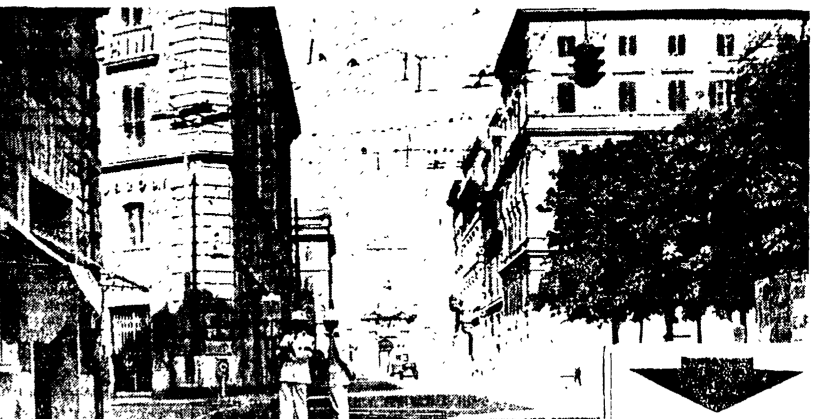
Oggi si conclude il lungo Ferragosto, e molti di coloro che hanno abbandonato la città giovedì sera o venerdì mattina, rientrano per riprendere regolarmente il lavoro lunedì mattina. La giornata di Ferragosto è trascorsa in un'atmosfera di quiete e di attesa, con le strade abbandonate da un sole rovente senza rimesse complete. I turisti si sono dispersi, e i romani hanno ripreso il loro ritmo di vita.