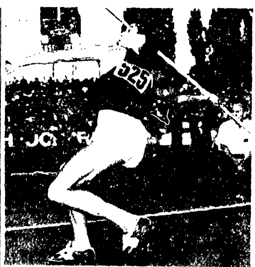
Il sovietico KUZNETSOV, si facilmente aggiudicato il titolo europeo nel decathlon