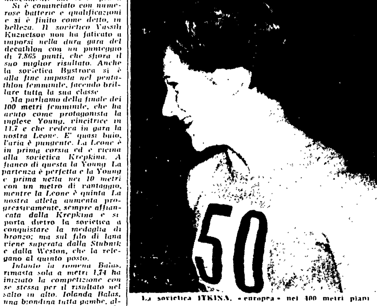
La sovietica IIKINA, «europea» nel 400 metri piani

La Croce rossa sportiva, ritenuta un terreno più facile per il dialogo, ha tentato di mediare tra il governo cinese e il governo americano. Le cause della crisi sono dunque molto chiare. Il Brundage, presidente della Croce rossa americana, ha rifiutato di accettare la partecipazione dei cinesi alle Olimpiadi del 1960, a causa del riconoscimento della Repubblica di Formosa. Il governo cinese ha risposto che non accetterà le Olimpiadi se il Brundage non si dimetterà e se il governo americano non riconosce la Repubblica popolare cinese.