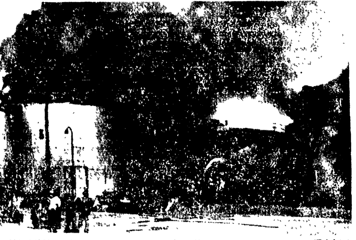
MARSIGLIA - Bruciano i serbatoi di petrolio a Moreplanne

Milioni di litri di petrolio andati in fiamme - Sei morti a Parigi e feriti gravi a Marsiglia - Danni per miliardi di franchi