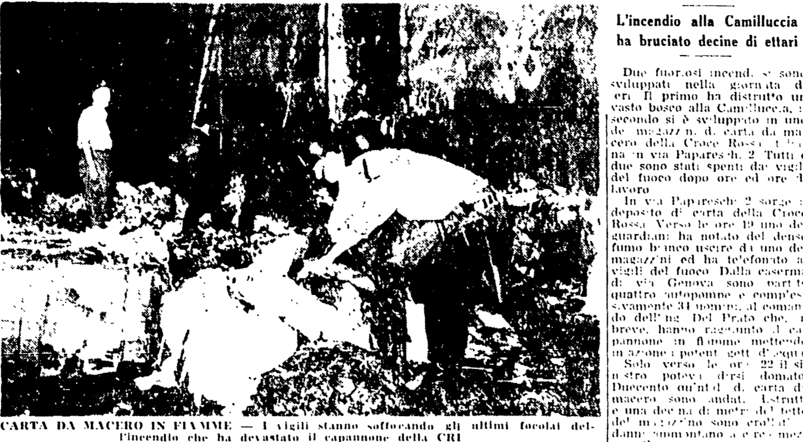
L'incendio alla Camillecia ha bruciato decine di ettari

Due furiosi incendi si sono sviluppati nella giornata di ieri. Il primo ha distrutto un vasto magazzino della CRI, il secondo si è sviluppato in una zona boschiva di circa 20 ettari della Croce Rossa. I due incendi sono stati spenti dai vigili del fuoco dopo ore di lavoro.