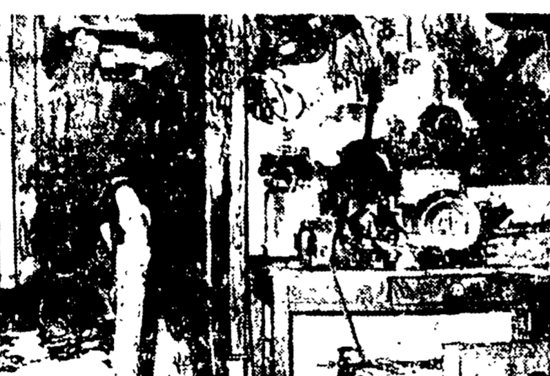
L'appartamento devastato dallo scoppio della bomba

Una bomba di gas liquido è esplosa in un appartamento di via del Tufo, distruggendo completamente un appartamento. Il padre di un pensionato ha trascinato il figlio fuori della stanza un attimo prima dell'esplosione.