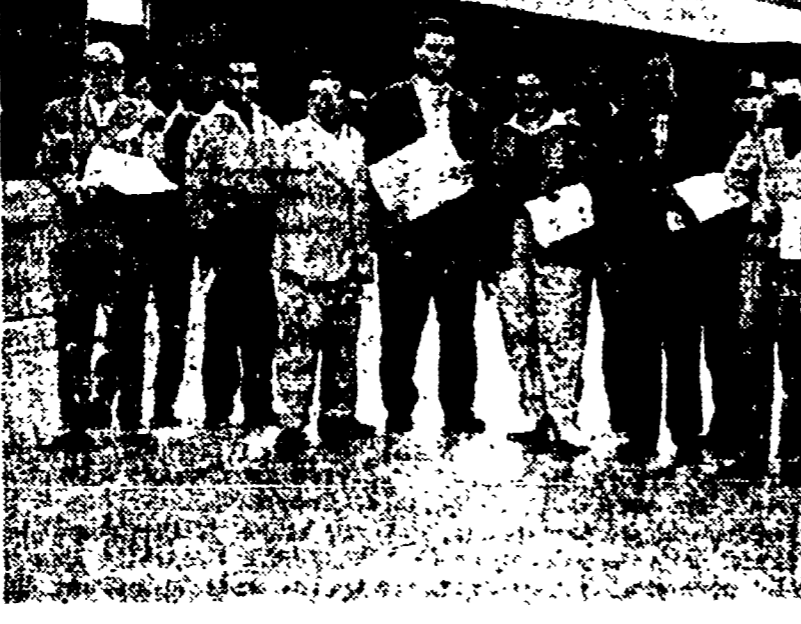
TERNI - Davanti all'ingresso delle Acciaierie, ieri mattina alle 5.30, poco prima dell'inizio del lavoro del primo turno i componenti del Comitato federale e della Commissione provinciale di controllo hanno effettuato una massiccia dimostrazione di protesta.

La Federazione di Viterbo ha già sottoscritto 1.750.000 lire e aumentato la diffusione domenicale