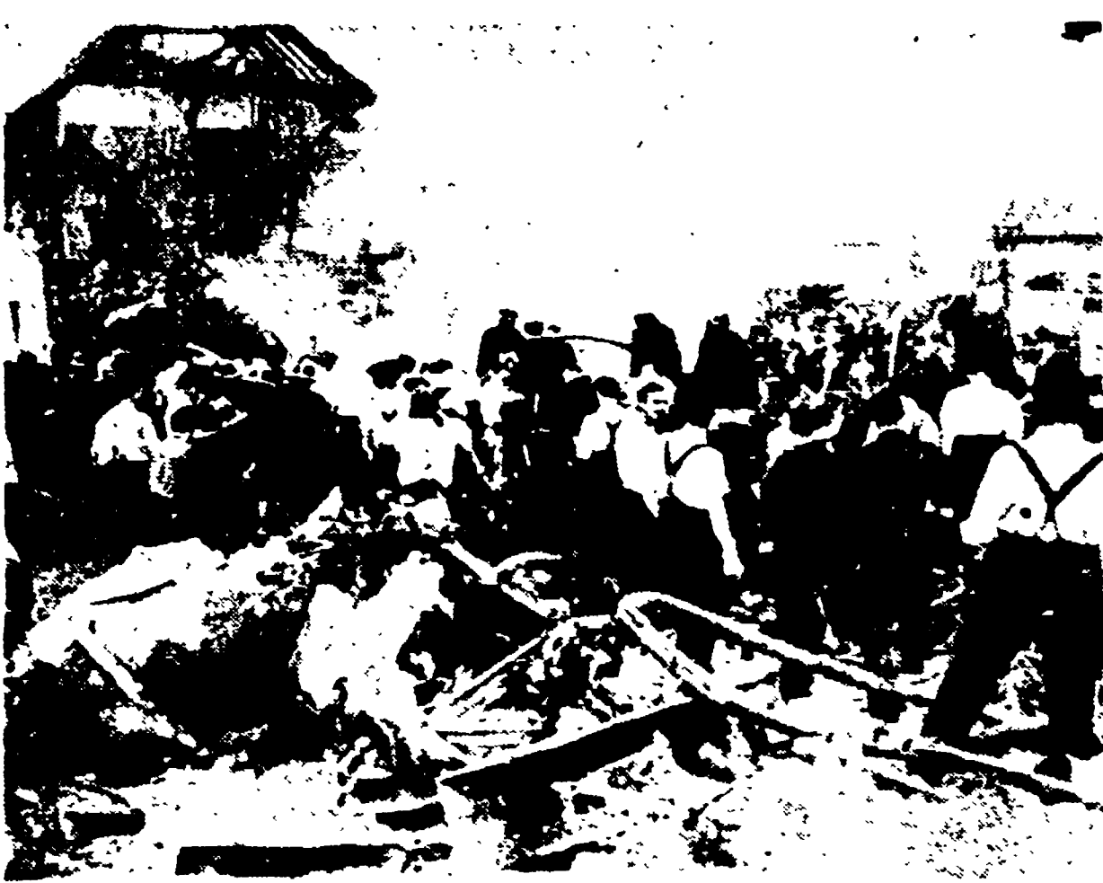
SOUTHALL - Il luogo del disastro mentre numerosi agenti e pompieri sono all'opera per spegnere le fiamme causate dall'esplosione.

LONDRA, 2. - Un bimotore «Vickers Viking» britannico, appartenente a una società aerea indipendente, è precipitato stamane su un gruppo di case nell'immediata vicinanza dell'aeroporto di Londra, nel sobborgo Southall.