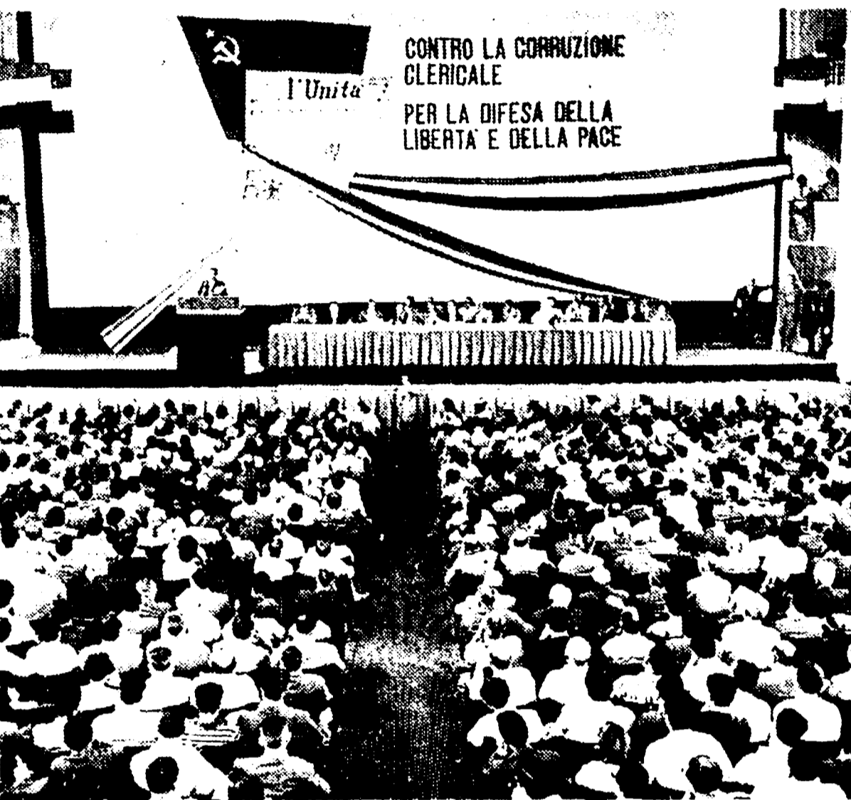
Un aspetto della sala dell'Adriano durante la manifestazione per il Mese della Stampa