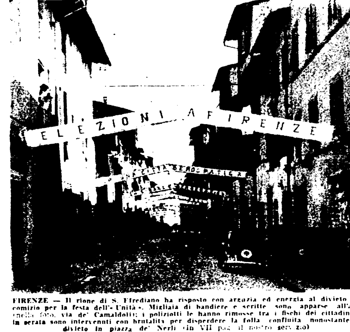
FIRENZE — Il rione di S. Frediano ha risposto con ardezza ed energia al divieto del comizio per la festa dell'Unità. Migliaia di bandiere e scritte sono apparse all'alba della festa, via de' Camaldoli; i poliziotti le hanno rimosse tra i fischi dei cittadini. Il divieto in piazza de' Nerli (in VII pag. il nostro servizio)