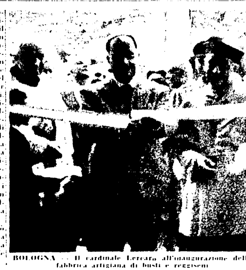
BOLOGNA — Il cardinale Ferrero all'inaugurazione della fabbrica artigianale di busi e reggioni

Domani si riaprirà finalmente il Parlamento. Fra gli organi di stampa, il giornale di Gedda e Vinci chiede che il PCI sia messo nell'illegalità. A Bologna si starebbe concretizzando una manovra per chiudere tutto l'affare con un fallimento concordato. I rapporti fra Giuffrè e la Curia.