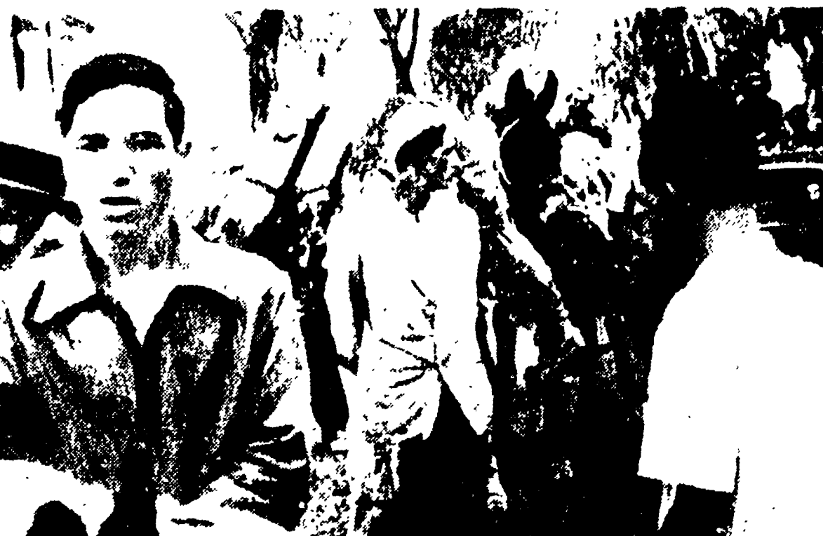
Questo acciaccato documento è stato inviato dal servizio fotografico dell'Ufficio stampa e informazioni del Fronte di liberazione nazionale algerino. Esso mostra dei paracadutisti (si intravede in fondo a destra una jeep), dei gendarmi e dei civili al servizio dell'invasore francese, mentre conducono per le vie di Palermo - a mo' di esempio - alcuni molti sul quali sono legati cadaveri di civili assassinati perché sospetti di aver aiutato i partigiani. Esattamente lo stesso, non dimenticato, comportamento delle SS e delle « Brigate nere ». La didascalia dell'Ufficio stampa e informazioni del FLN aggiunge che il fotografo che ha scattato questa immagine è stato arrestato e ucciso a sua volta, ma che prima di essere preso è riuscito a mettere in salvo la macchina fotografica con la preziosa pellicola.