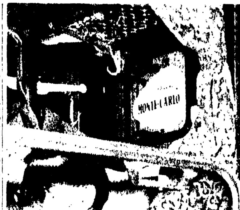
Il capo della Mobile dottor...