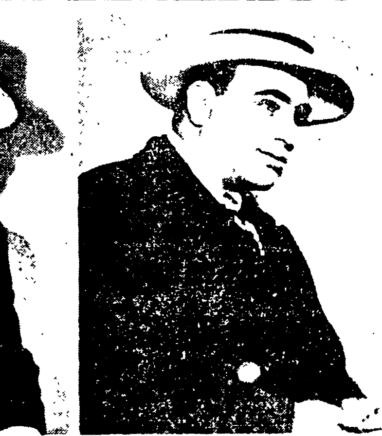
Si sta girando a Hollywood un film sulla vita di Al Capone. Ad interpretare la parte del protagonista è l'attore Rod Steiger, che gli somiglia incredibilmente. A sinistra: i fratelli e l'immagine del vero Al Capone, e a destra quella dell'attore Steiger.

«SE AVESTE 200 MILIONI A DISPOSIZIONE, QUALE FILM REALIZZERESTE?» I sogni nel cassetto dei registi francesi