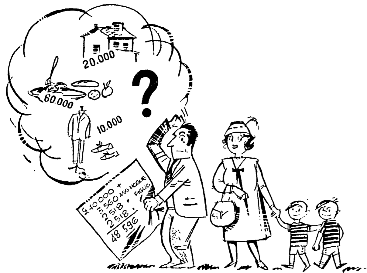
Mancano 41.401 lire all'80% de gli statali per pagare le spese essenziali

Un altro compagno denunciato perché non impedì la trattazione di « argomenti proibiti »