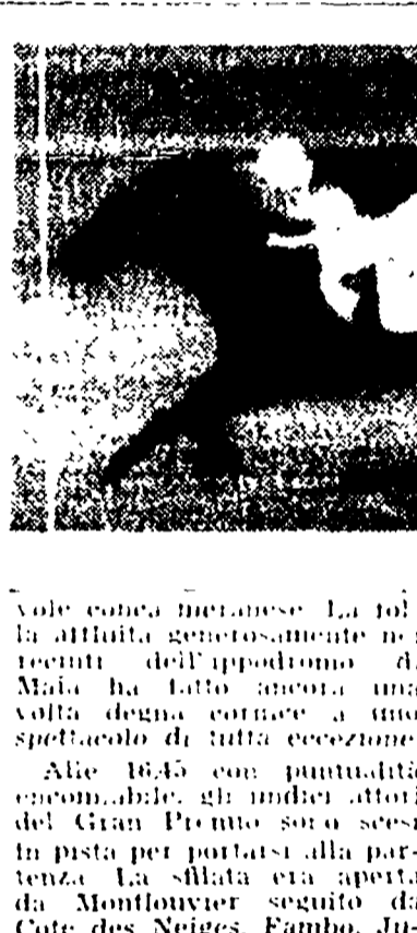
Il fantino di Tafilatet, che è stato abbattuto sulla pista.

MERANO, 28. - C'era aria di riscossa alla vigilia del Gran Premio Merano nelle scuderie dei cavalli italiani. Quest'anno i tentati esili francesi non sembravano insuperabili mentre le scuderie di casa potevano contare su soggetti giovani e capaci, in quanto a mezzi come Augustine, Non Noe e Landolo.