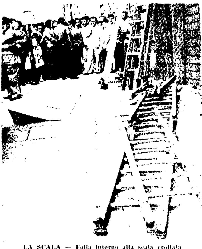
LA SCALA — Folla intorno alla scala crollata