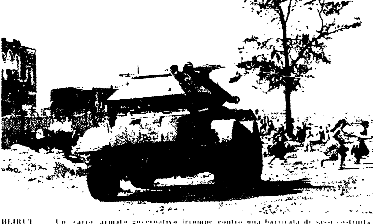
BEIRUT — Un carro armato governativo irrompe contro una battaglia di sassi costanti dei ribelli chiomisti.

«Il Gamharra» pubblica i documenti del complotto turco-americano contro la Siria nel 1956