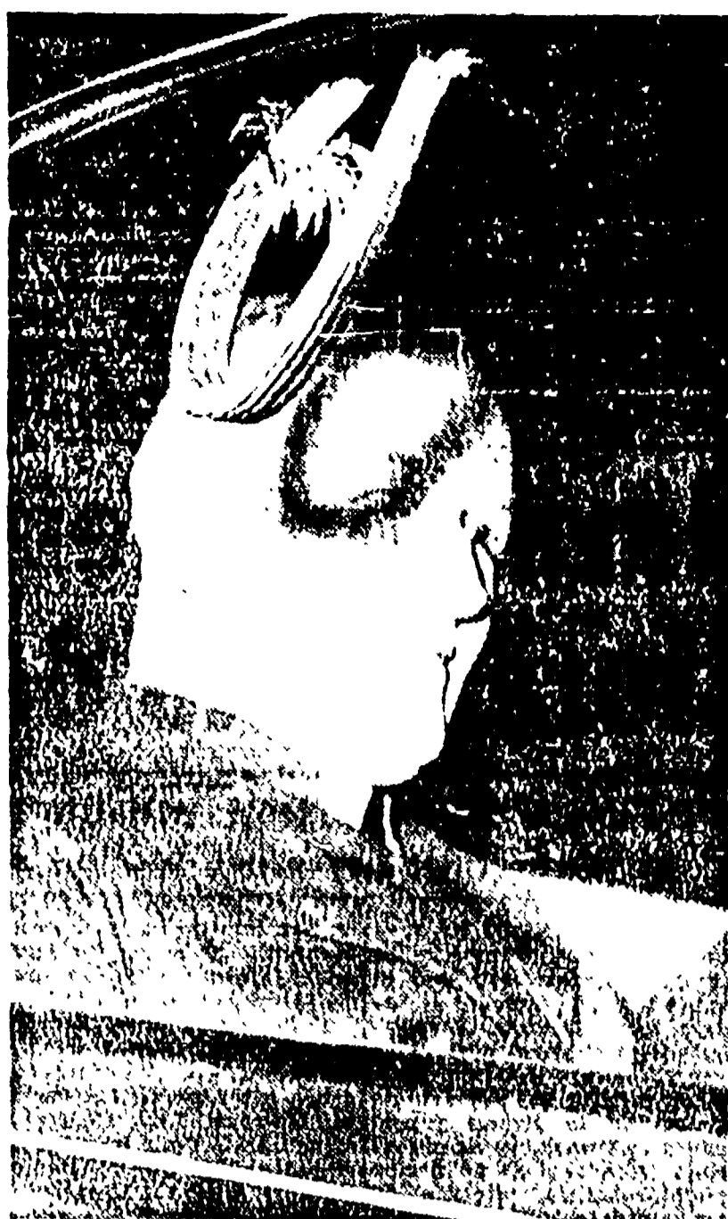
Alcide De Gasperi

Aspre critiche della stampa borghese — Le contraddizioni messe in luce dal prossimo viaggio di Fanfani al Cairo e dalla visita a Roma dello Scià di Persia