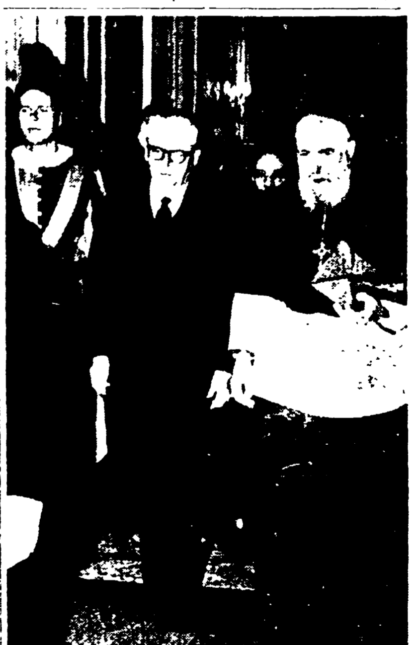
CASTELGANDOLFO - Il Presidente Gronchi e l'onorevole Fanfani (alle sue spalle) accompagnati dal cardinale Tisserant si recano a rendere omaggio alla salma di Pio XII