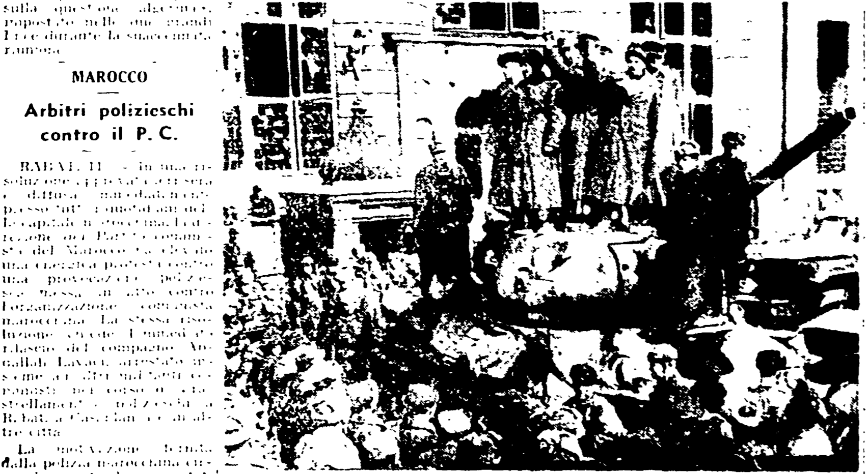
BARSAVIA - Ricorrendo in questi giorni l'anniversario della battaglia di Lenino con battuta da reparti polacchi a fianco dell'esercito rosso contro i nazisti, la Polonia festeggia il XV anniversario dell'esercito polacco...