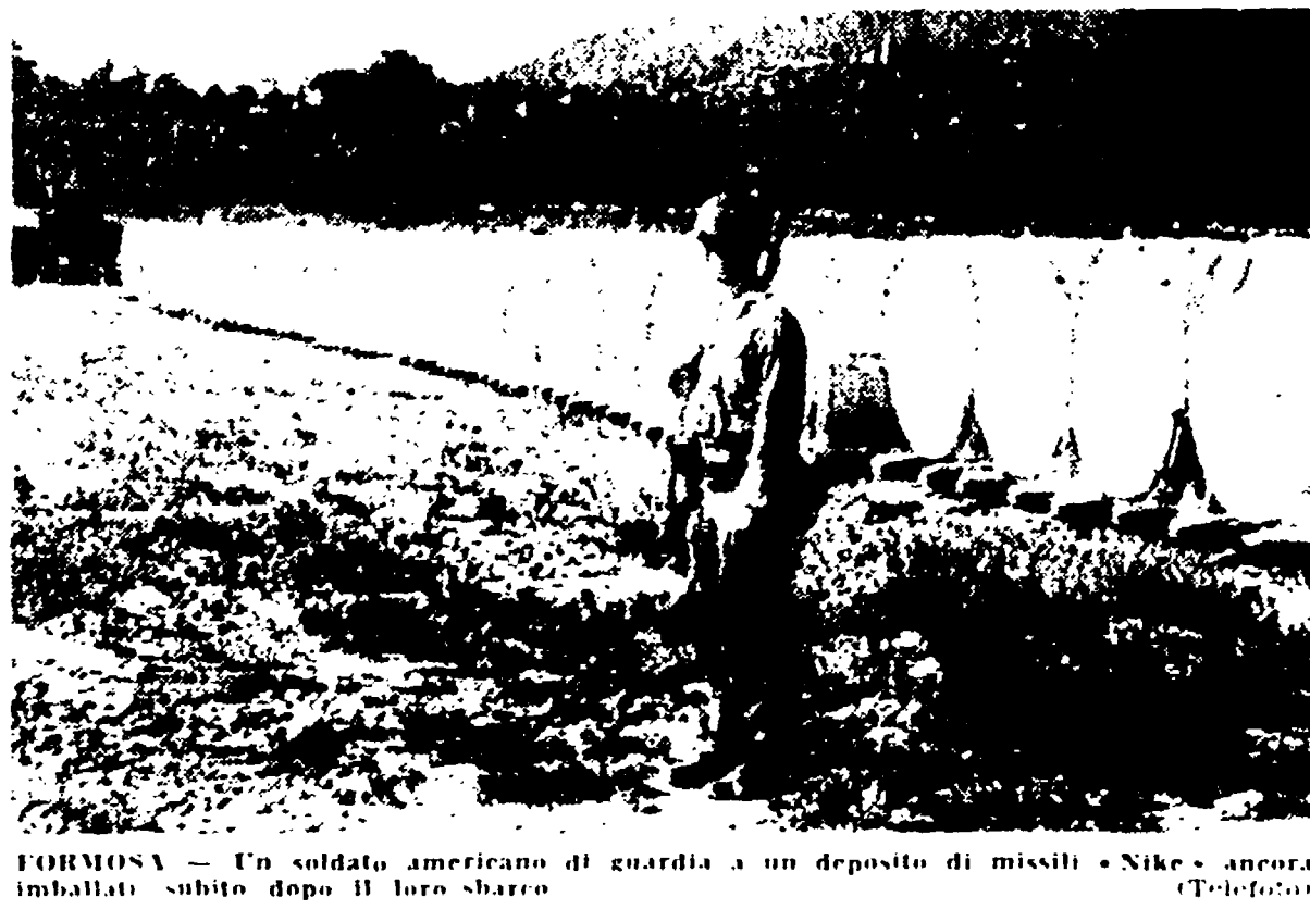
FORMOSA — Un soldato americano di guardia a un deposito di missili « Nike » ancora imballati subito dopo il loro sbarco

WASHINGTON, 17 — Fu... (text continues with news about Dulles and Cian)