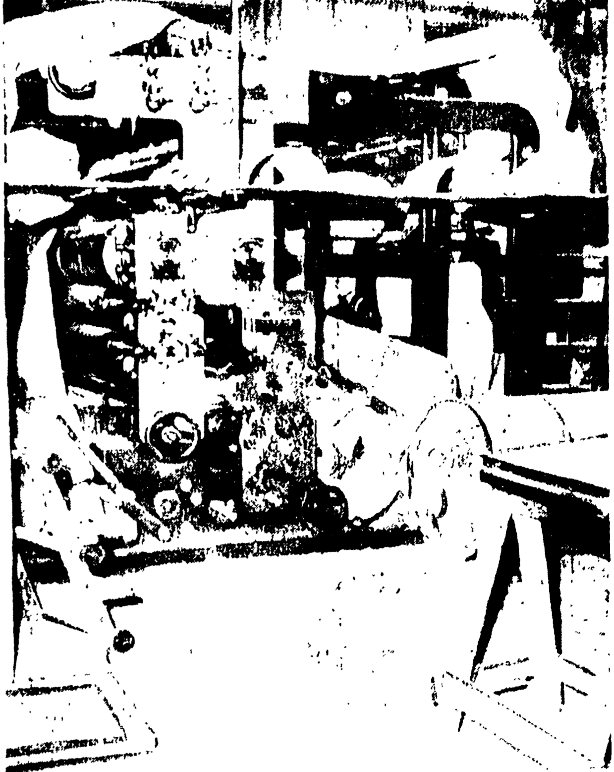
Palermo. La tipografia dell'«Ora» dopo l'attentato.

Il grave atto intimidatorio compiuto per fermare un'inchiesta con clamorose rivelazioni sulla delinquenza e sui suoi legami con la D.C. - La tipografia salva - Danni gravi ai negozi circostanti