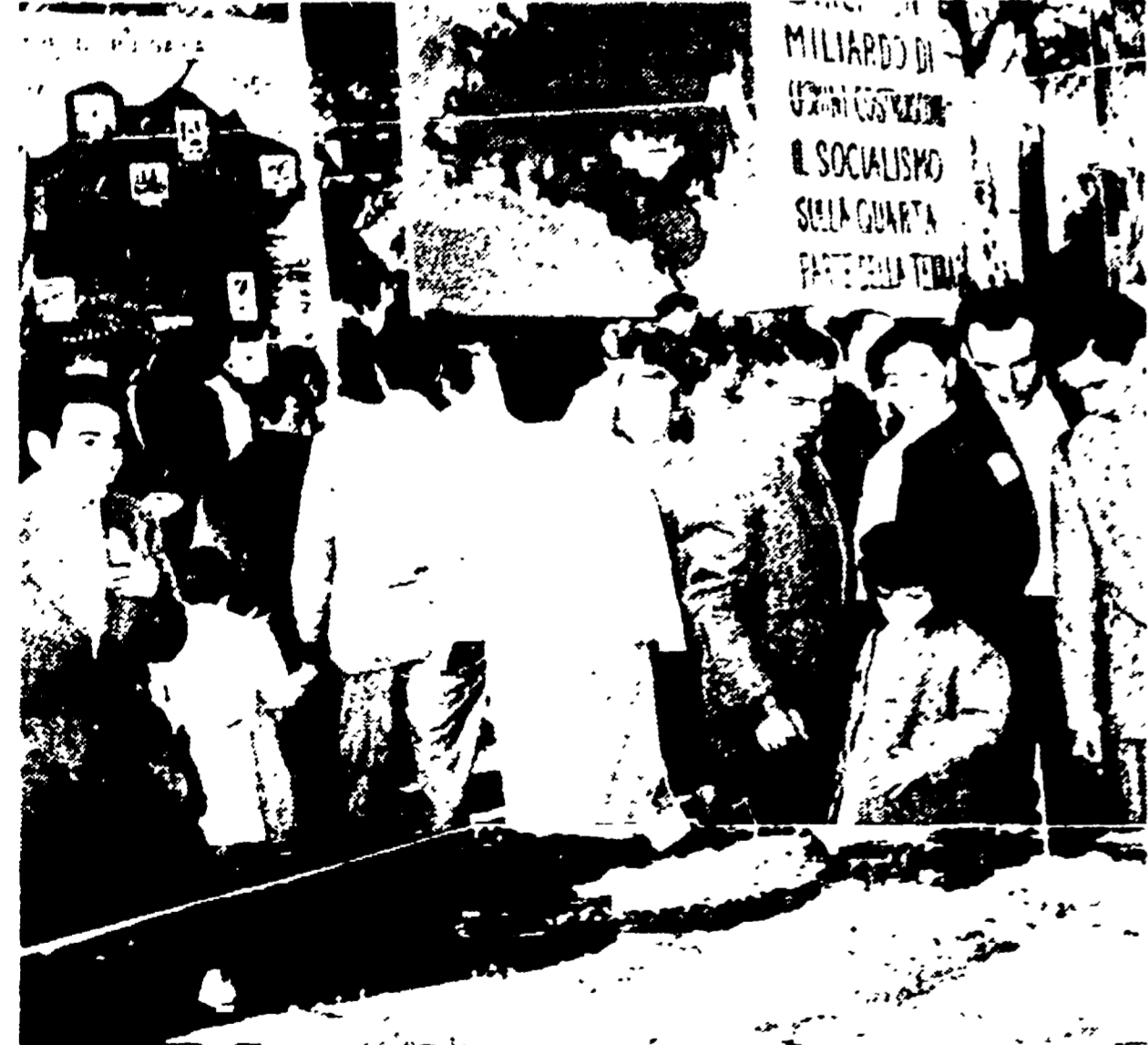
Molta folla ieri nel parco romano di Villa Glori per la festa provinciale dell'Unità. Nella foto un gruppo di visitatori davanti ad un pannello delle mostre che mostra le posizioni dell'esercito popolare sulle coste e quelle nazionaliste e americane dell'isola di Quemoy.

Una grande folla di cittadini ha celebrato ieri a Villa Glori la tradizionale festa dell'Unità nella Capitale, animando per tutta la giornata gli stand e le trattorie all'aperto, nel clima delle più belle giornate dell'autunno romano. Nel cuore della festa, sul largo piazzale, quando il sole volgeva al tramonto, si è ammassata la maggior parte della folla e si è aperto il comizio. Sul palco ornato di bandiere, sono saliti i compagni Amendola, Pajetta, Bufalini, Di Giulio, Perini, Nannuzzi, D'Onofrio, Casapuoti, Reichlin, Maccocchi, Orlando, Franceschelli, Camillo, Ranalli, Giunti, Bellugi e Cesaroni, e i compagni socialisti Venturini, Bigarelli e Moronesi. Il compagno Camillo, responsabile del Comitato e tradito da un pezzo dal partito, ha detto: «Il mese della stampa comunista, egli ha detto, ha