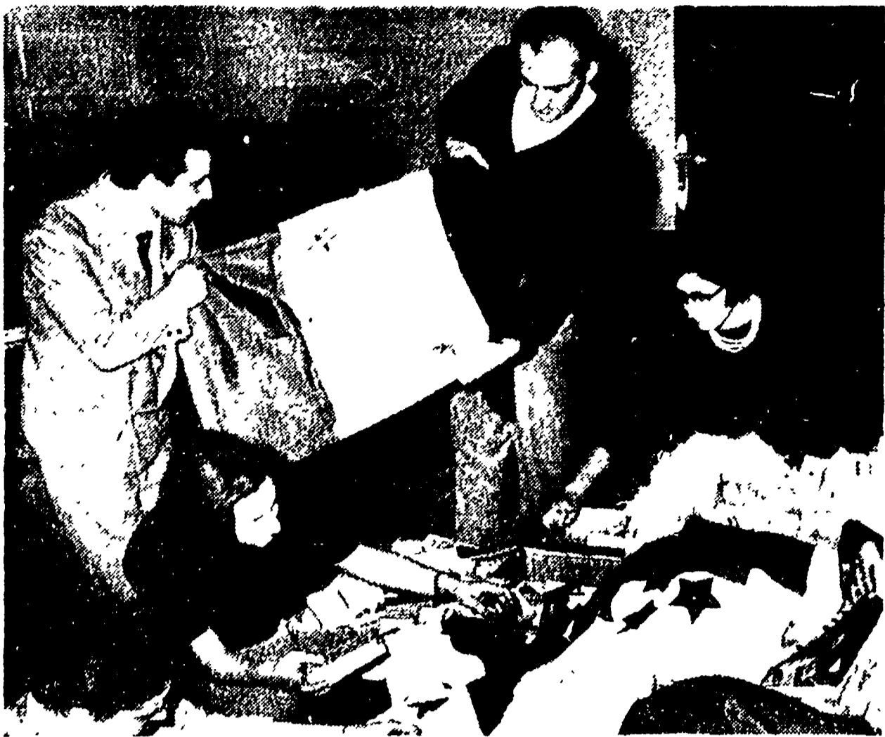
Si preparano medicinali e handle per i combattenti algerini

Il delegato dell'U.L.A. algerino cui sono state consegnate le prime bandiere in occasione della Conferenza anticolonialista ha detto: «Il gesto della gioventù italiana non solo è di sostegno alla nostra lotta ma è di innamento a quanti, nel mondo, hanno coscienza che la causa della indipendenza e della pace è indivisibile».