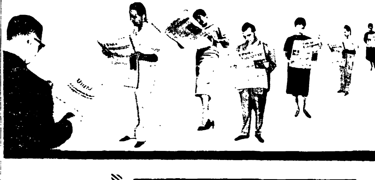
50.000 abbonamenti all'Unità il giornale che si batte per la democrazia e il progresso del popolo italiano