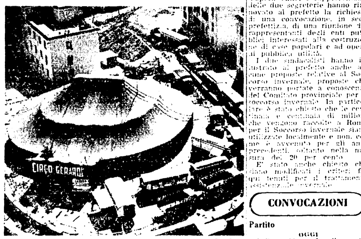
Questa sera debutta a Roma in via delle Cave il CIRCO GERARDO. Leoni, acrobati, giocolieri, fantasisti, clown, indiani, costituiscono i numeri più appassionanti di questo spettacolo che rinnova l'eterna magia del circo, un spettacolo antico quanto nuovo, che da sempre afflitta grandi e piccoli.