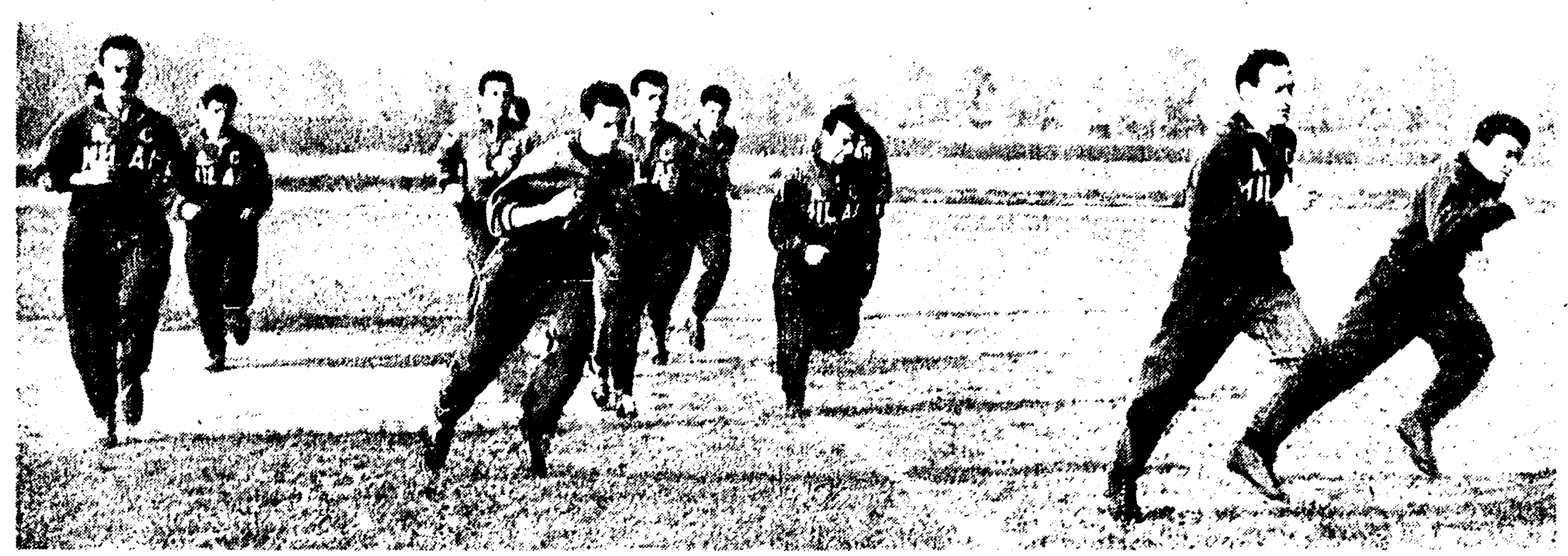
● Juventus-Milan, incontro all'azione. I «viola» a Padova non dovrebbero perdere. Incontri all'insegna del tifo a Napoli e Genova.