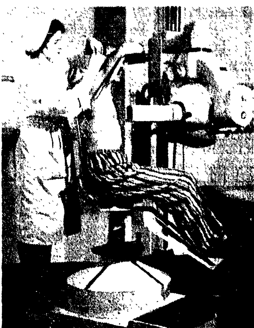
Un paziente affetto da tumore maligno viene sottoposto a una cura con radiazioni in un clinica sovietica.