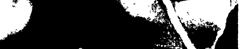
Tatiana Samoilova con Alexei Batalov nel film di Kalatozov...