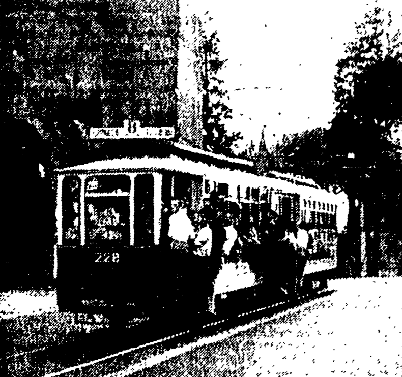
Per questi servizi si paga già troppo