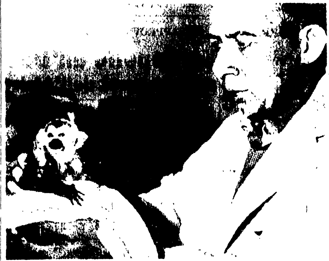
CAPE CANAVERAL. - Una scimmia della marina con la scimmietta prima che essa venisse collocata nell'abitacolo in cima allo "Jupiter".

Una scimmia della marina con la scimmietta prima che essa venisse collocata nell'abitacolo in cima allo "Jupiter".