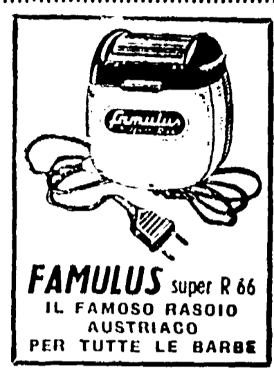
FAMULUS super R 66 IL FAMOSO RASOIO AUSTRIACO PER TUTTE LE BARBE