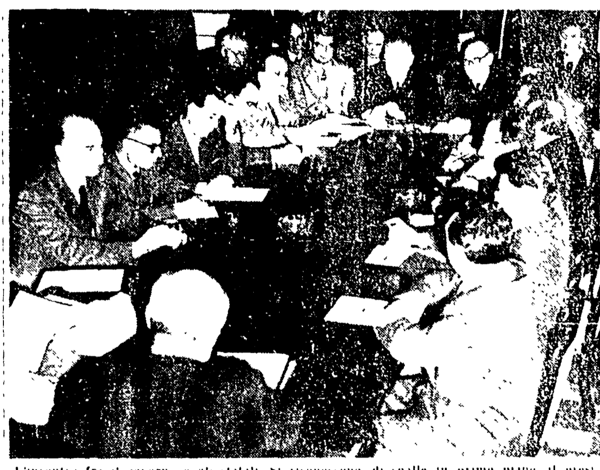
L'incontro fra il governo e gli statali. Si riconoscono di spalle in primo piano il presidente del Consiglio Fanfani e di fronte i segretari confederati Novella e de'...

Mille lire di aumento per la moglie e i figli - La "scala mobile", ne darà al massimo altre 1600 Entro l'8 gennaio i rappresentanti dei lavoratori presenteranno le loro controproposte