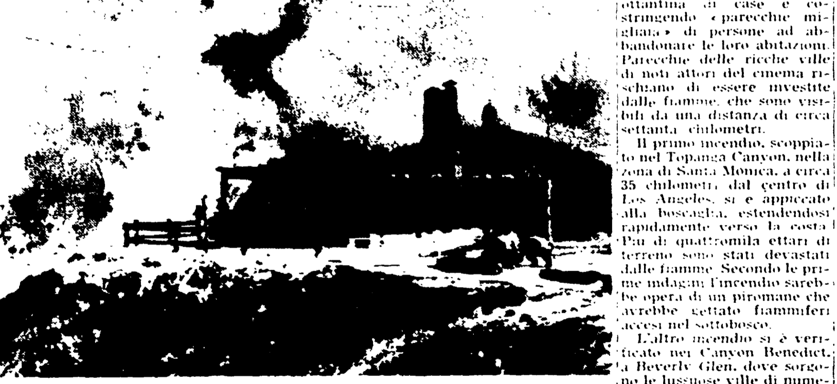
TOPANGA CANYON - Nell'incendio del bosco che circonda la città è andato distrutto anche un ristorante, completamente divorato dalle fiamme. A destra sono visibili i villi del fuoco in azione

Migliaia di persone in fuga - Minacciate le ville di famosi attori di Hollywood