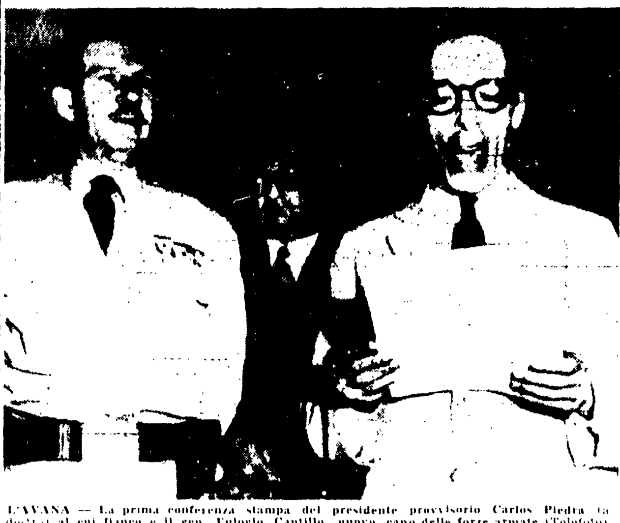
L'AVANA - La prima conferenza stampa del presidente provvisorio Carlos Prío (a destra) al cui fianco è il gen. Eugenio Cantillo, nuovo capo delle forze armate d'oltramarina

(Continuazione dalla 1. pagina) tarda sera una gran folla era ammassata davanti al carcere e reclamava a gran voce la liberazione dei detenuti politici. Alcune centinaia di prigionieri sono già stati liberati. Qualche altro incidente più grave si verificò in un'ottava.