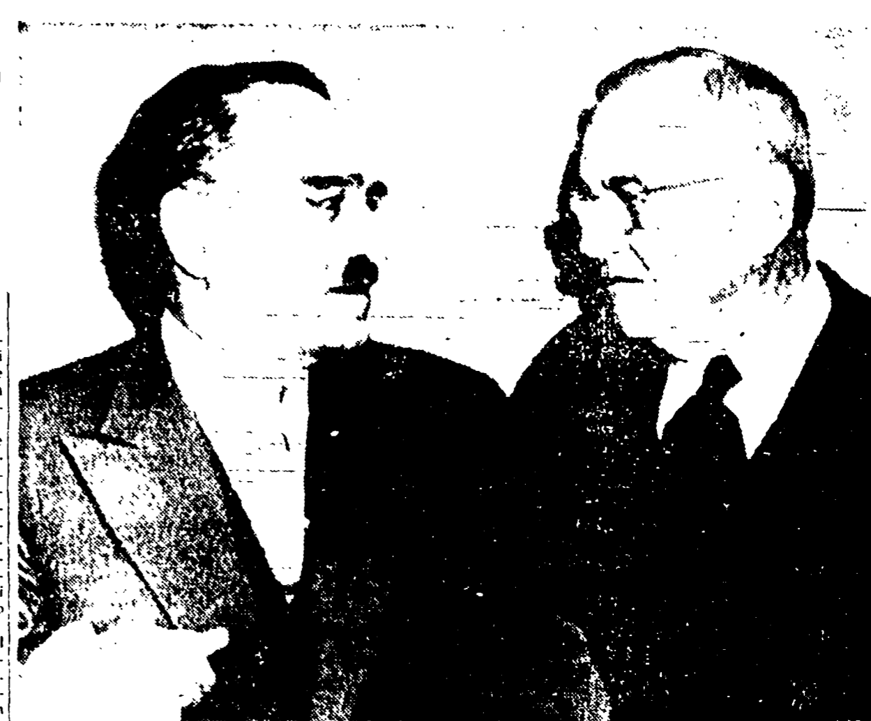
WASHINGTON - Mikojan e Foster Dulles durante il loro colloquio