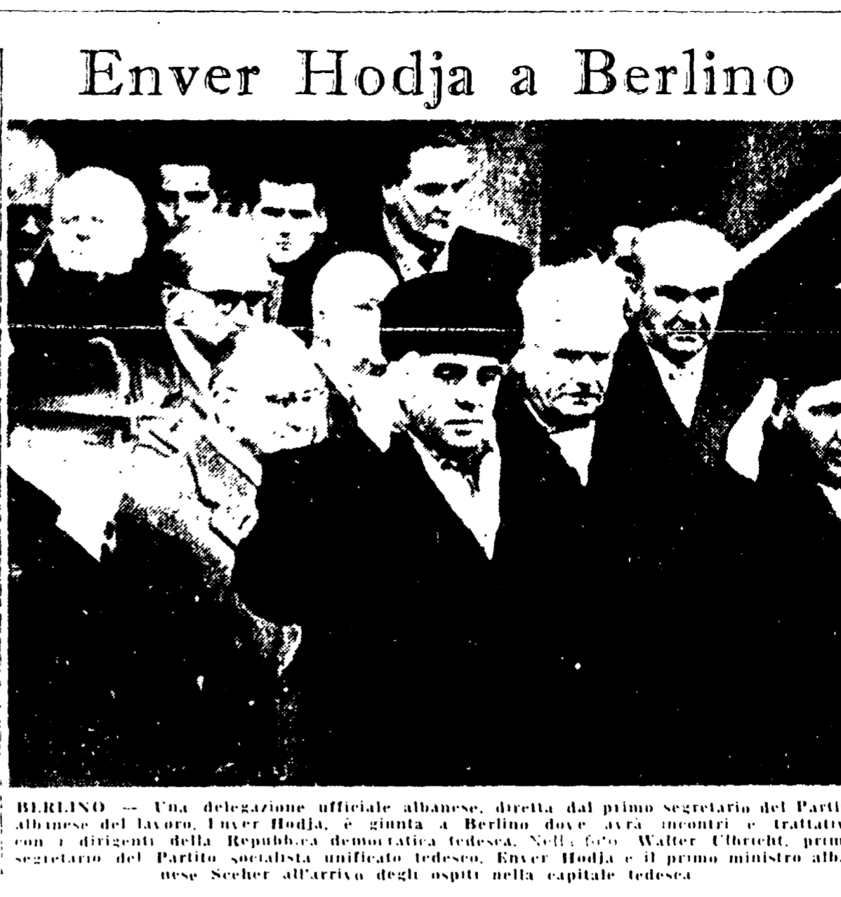
BERLINO — Una delegazione ufficiale albanese, diretta dal primo segretario del Partito albanese del lavoro, Enver Hodja, è giunta a Berlino dove si incontra con i dirigenti della Repubblica democratica tedesca. Nella foto Walter Ulbricht, primo segretario del Partito socialista unificato tedesco, Enver Hodja e il primo ministro albanese Sheker all'arrivo degli ospiti nella capitale tedesca.