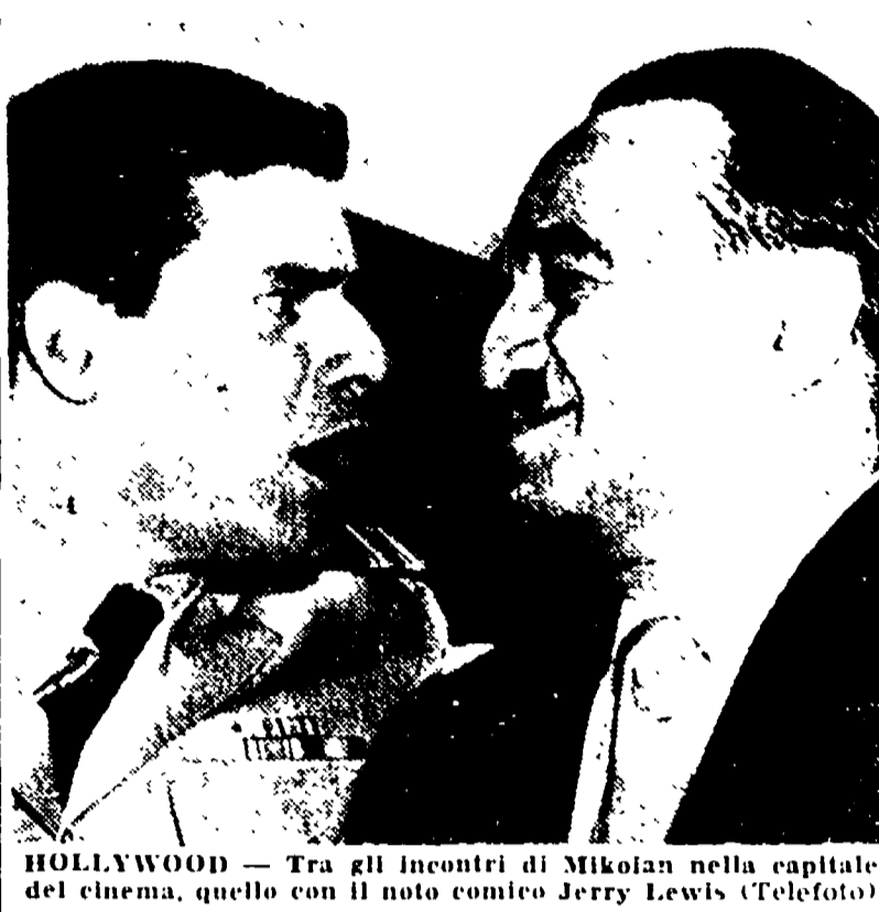
HOLLYWOOD - Tra gli incontri di Mikoyan nella capitale del cinema, quello con il noto comico Jerry Lewis

WASHINGTON, 14. - Mikoyan ha iniziato oggi il suo soggiorno newyorkese partecipando al banchetto offertogli, come preannunciato dalla First National City Bank.