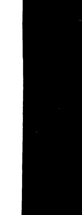
LIVORNO - Una delle scialuppe di salvataggio mentre si avvicina alla riva (Telefoto)

Esperita questa prima operazione di salvataggio il dragamine ha preso a rimorchio le due scialuppe e si è diretto alla Capitaneria di porto dove tutti i naufraghi sono stati assiduamente assistiti e ristorati.