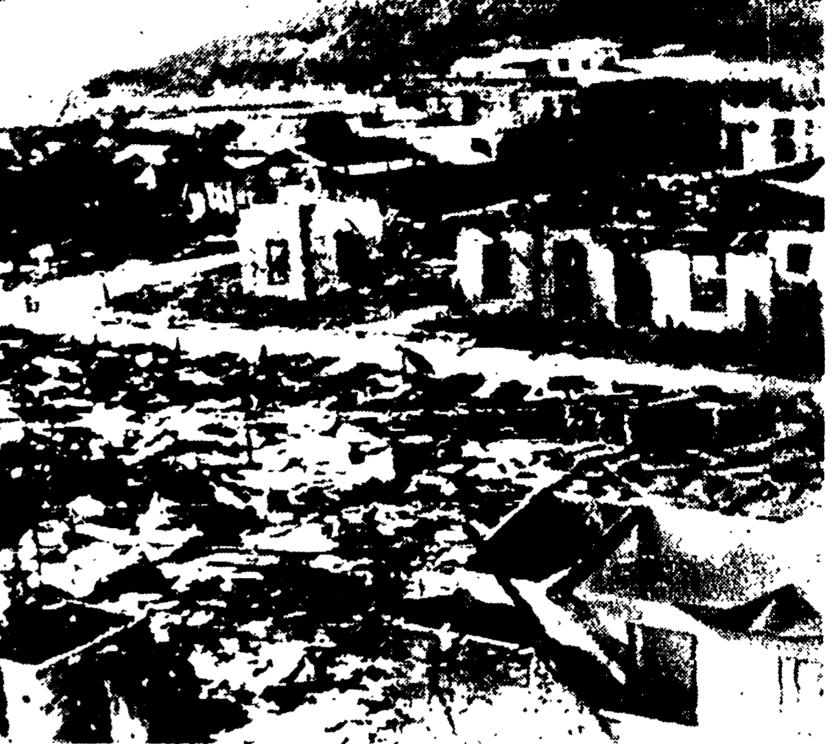
AVANA - Questa foto comparsa sui giornali cubani mostra una parte della città di Sagua de Tanamo, sulla costa settentrionale della provincia di Oriente, ridotta ad un cumulo di macerie. La città fu liberata il 21 dicembre dal regime di Batista per rappresentarla il ministro degli Esteri di Cuba, Roberto Agramonte, ha fruttato replicato alle accuse avanzate da alcuni parlamentari statunitensi i quali hanno protestato per le esecuzioni di alcuni criminali, rilevando che sotto il regime del dittatore Batista sono state uccise ventimila persone, fra cui donne e bambini. (Telefoto)

Buenos Aires, 16 - Nella città di Tucuman, nel centro della provincia di Tucuman, la polizia argentina ha sparato contro un gruppo di operai che si erano radunati per protestare contro la chiusura di una fabbrica. Sono stati feriti diversi operai e uccisi alcuni bambini.