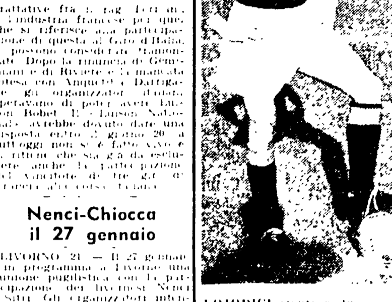
LOIODICE rientra in squadra a Torino al posto di Da Costa ammalato

Il numero dei corridori di marca che si sono presentati per il Tour de France, è di 100. Il numero dei corridori di marca che si sono presentati per il Tour de France, è di 100.