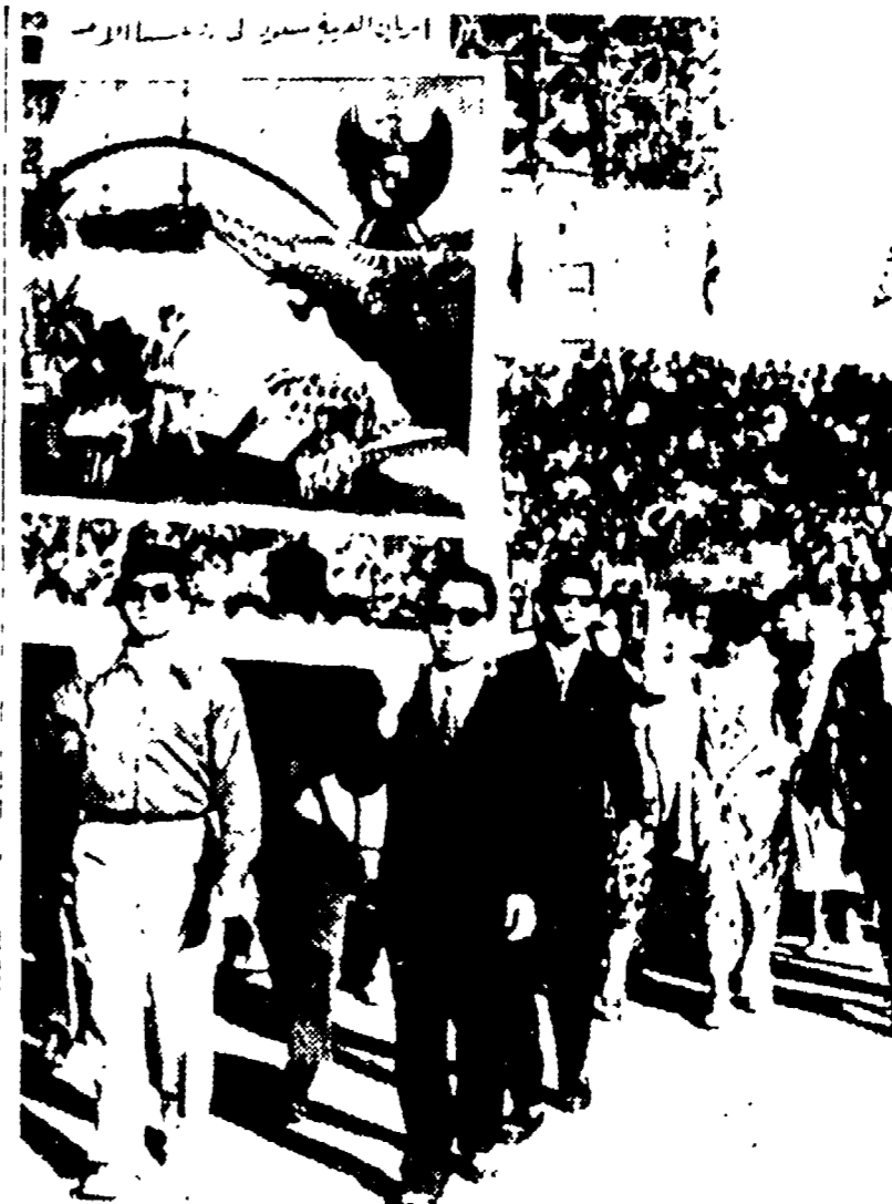
Manovre nella flotta americana. WASHINGTON, 5. — Oltre 40 navi da guerra della marina americana stanno attualmente svolgendo manovre nel Mediterraneo. Le navi sono state inviate in questo mare per svolgere manovre che si svolgeranno nel Mediterraneo Occidentale e a partire dal 15 febbraio.

WASHINGTON, 5. — Oltre 40 navi da guerra della marina americana stanno attualmente svolgendo manovre nel Mediterraneo. Le navi sono state inviate in questo mare per svolgere manovre che si svolgeranno nel Mediterraneo Occidentale e a partire dal 15 febbraio.