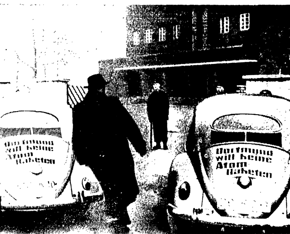
DORTMUND - Una manifestazione contro l'installazione di missili nella Germania Occidentale organizzata dal partito socialdemocratico ha avuto luogo a Dortmund. Nella foto: un'automobile fermata dalla polizia inglese su cui sono issati cartelli con la scritta "Dortmund non vuole missili atomici". Sotto: un schieramento di politici tedeschi.

Sul terreno strettamente politico la giornata non presenta elementi di speciale interesse salvo la pubblicazione del testo di una lettera che il Comitato nazionale di azione laica, del quale fanno parte il segretario generale della Federazione dell'educazione nazionale e il segretario generale del Sindacato nazionale degli insegnanti, nonché altre personalità di rilievo, ha recentemente indirizzato al presidente della Repubblica per protestare contro le intenzioni del governo intese a concedere alla scuola confessionale la parità con la scuola governativa.