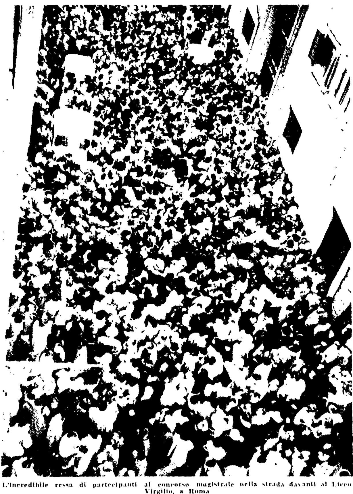
L'incredibile resta di partecipanti al concorso magistrale nella strada davanti al Liceo Virgilio, a Roma