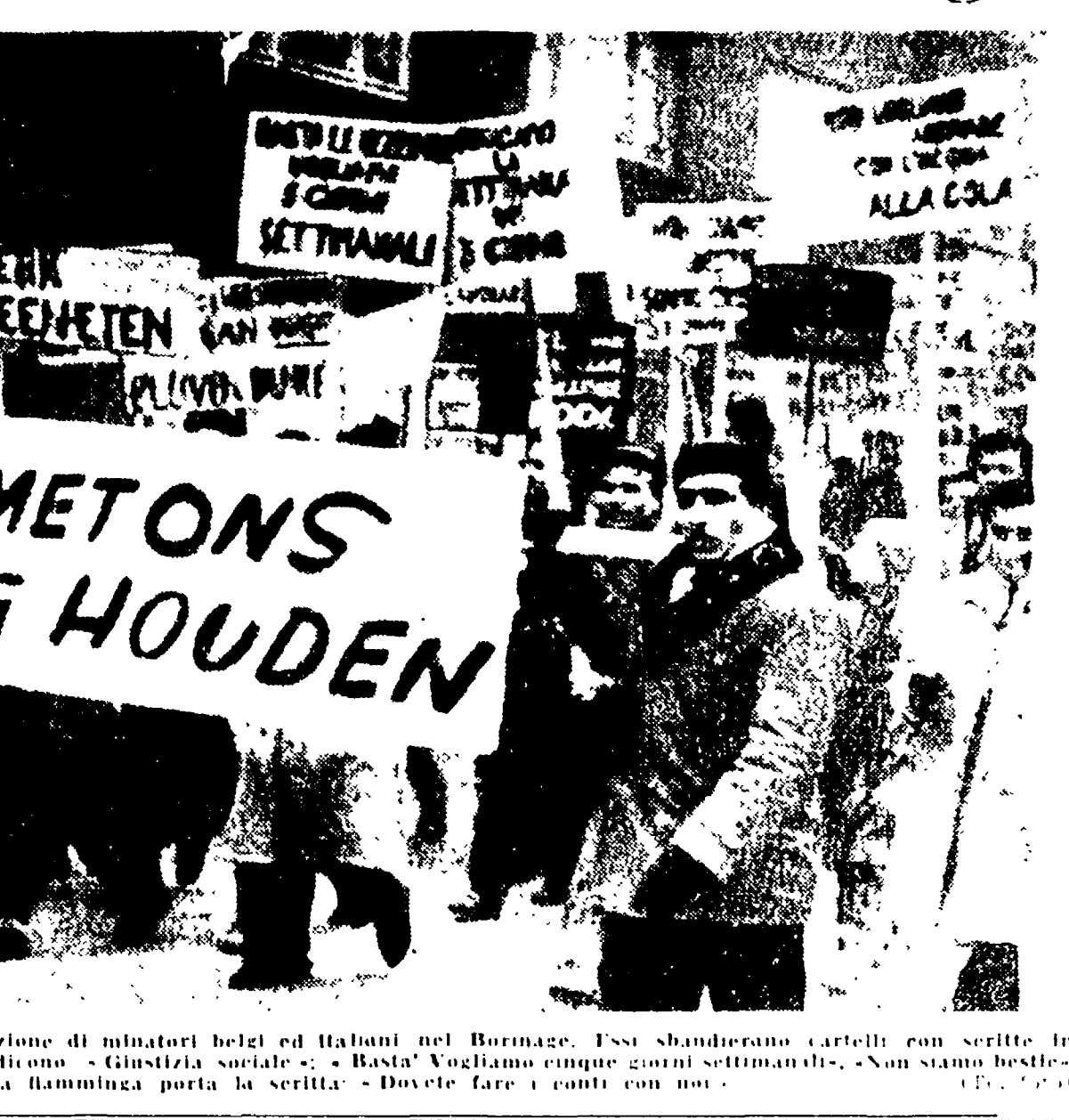
BRUXELLES — Una dimostrazione di minatori belgi ed italiani nel Borinage. Essi sbandierano cartelli con scritte in italiano ed in flammingo che dicono: «Giustizia sociale», «Basta! Vogliamo cinque giorni settimanali», «Non siamo bestie», «Un grande cartellone in lingua flamminga porta la scritta: «Dovete fare i conti con noi».