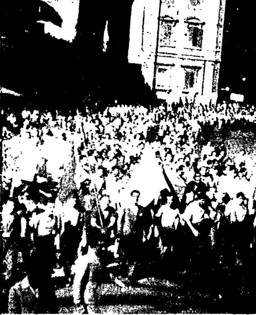
Una manifestazione popolare a Roma il 14 luglio '48. La trasposizione sul emigranti...