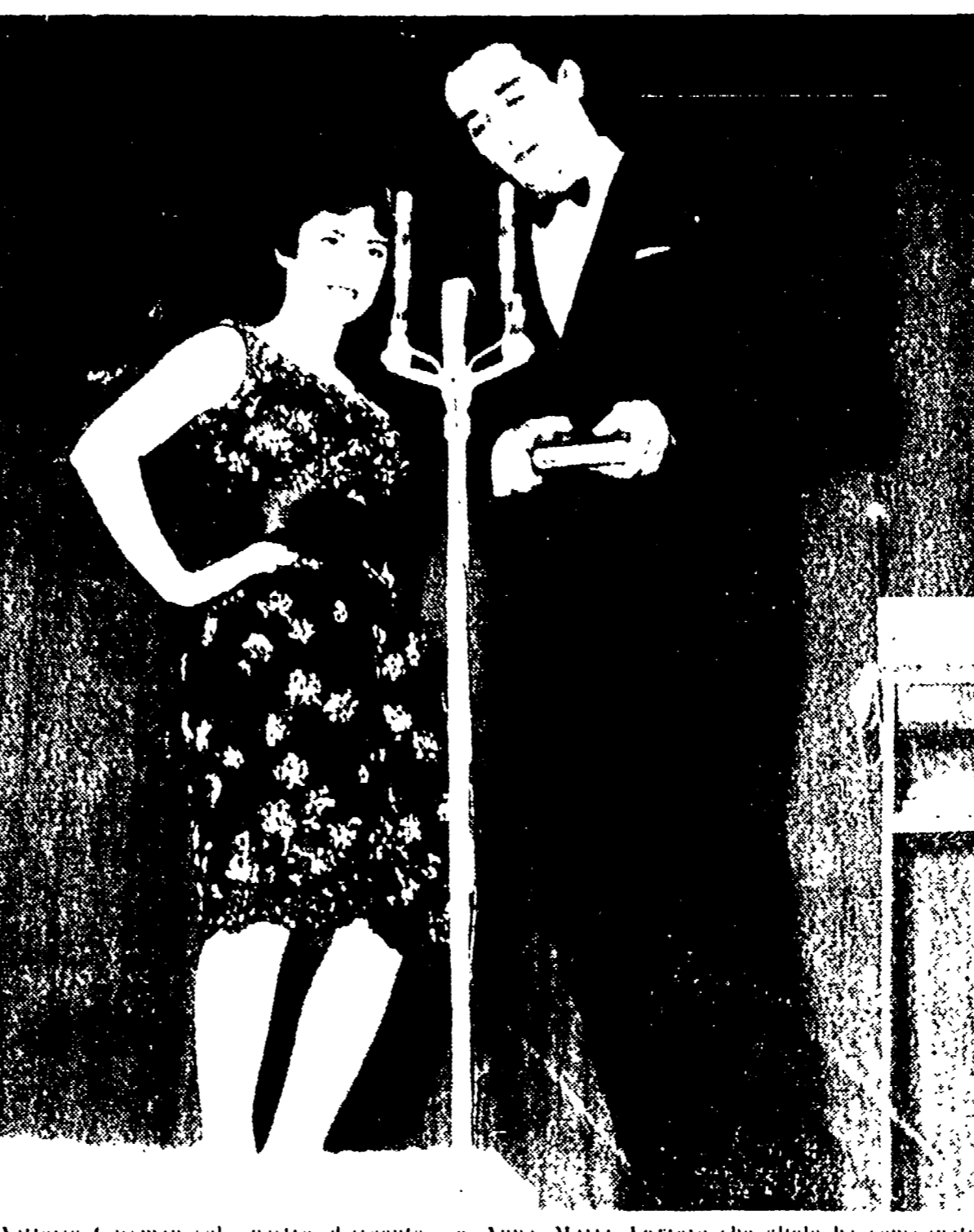
Alberto Sordi con il suo nastro d'argento e Anna Maria Ferrero che glielo ha consegnato...