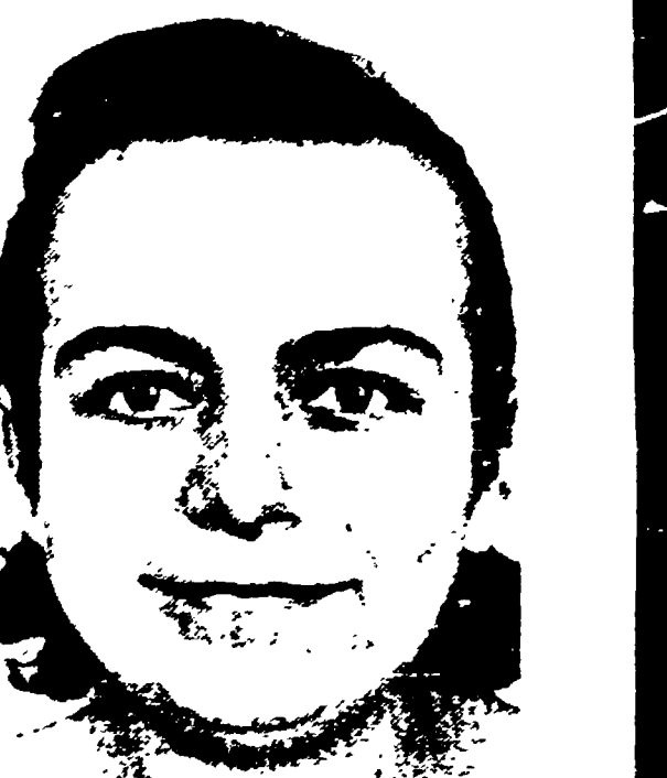
La stessa paziente dopo la cura

Da un punto di vista fisiologico, invece, si osservò una riativazione del sistema nervoso superio- re e la vasta fonte di poter ritornare a fare il lavoro di riferimento tra cervello e corpo. In un altro caso, il dottore di medicina, il cui nome non è da pubblicare, si sono sentiti i capelli alle tempie ricaduti.