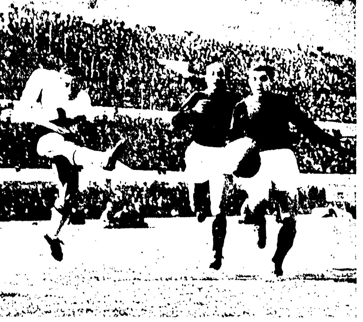
BOLOGNA ROMA L.O. - GHIGGIA ha offerto una bellissima prova degli atleti della Nazionale. Incisa appena mentre dove aver suggerito alcuni su azioni si rimonta nel tiro.

Il terzo giro il tedesco retrocedeva in conseguenza d'una caduta e Longo si trovava solo con Dufrasse e Brule, che poco dopo si distaccava leggermente. Longo e Dufrasse si davano il cambio nel condurre senza potersi separare ed entrambi assieme al traguardo.