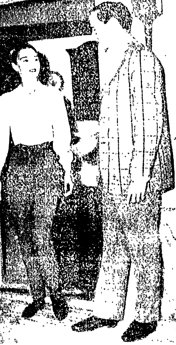
HOLLYWOOD - Audrey Hepburn, post per i fotografi recitata dal marito Al. L'attore nella sua casa di Hollywood. L'attrice muove i primi passi dopo la recente caduta dal cavallo avvenuta a Durango nel Messico. Non è ancora previsto quando potrà riprendere il lavoro.