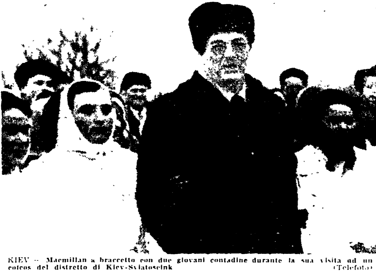
KIEV - Macmillan a braccetto con due giovani contadine durante la sua visita ad un colosso del distretto di Kiev-Svatoselnk

Il presidente del Consiglio Segni ha avuto un lungo colloquio col ministro degli Esteri Pella sulla situazione internazionale, con particolare riguardo al viaggio di Macmillan a Mosca.