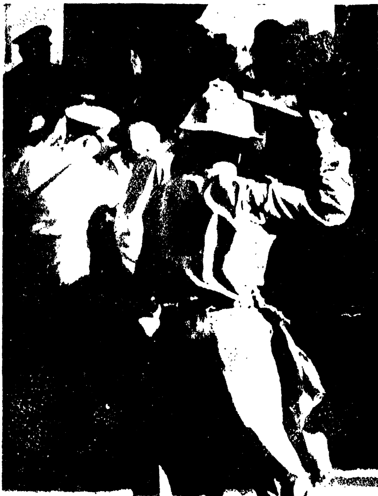
JOHANNESBURG. - Un poliziotto brandisce il suo manganella per colpire una donna negra della comunità di Lady Selborne vicino a Pretoria (sembravolta dalla figura del poliziotto). Dietro si intravedono altri poliziotti impegnati nella mischia. Il violento scontro fra le 2000 donne ed i poliziotti si è verificato in seguito ad una manifestazione di massa per protestare contro la legge che obbliga gli africani a portarsi sempre appresso una speciale permesso senza il quale non possono circolare. Nella scontro sono rimaste ferite ventidue donne alcune delle quali sono state rievacuate in ospedale

La tensione si è anche intensificata negli altri due territori della Federazione, la Rhodesia del nord e quella del sud. Nella capitale di quest'ultimo paese, Salisbury, sono stati abbisi manifesti incitanti allo sciopero generale per lunedì.