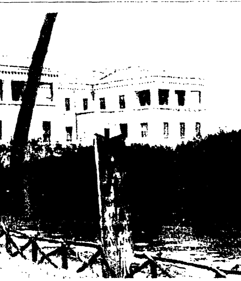
ALLA CELIOMONASTA - L'edificio ceduto dal ministero all'ordine dei Trinitari