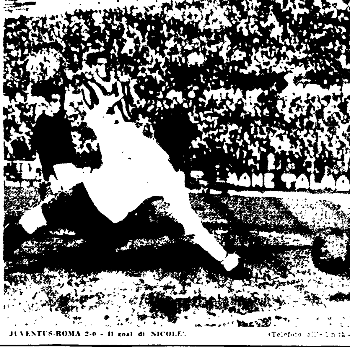
JUVENTUS-ROMA 2-0 - Il goal di NICOLÒ.