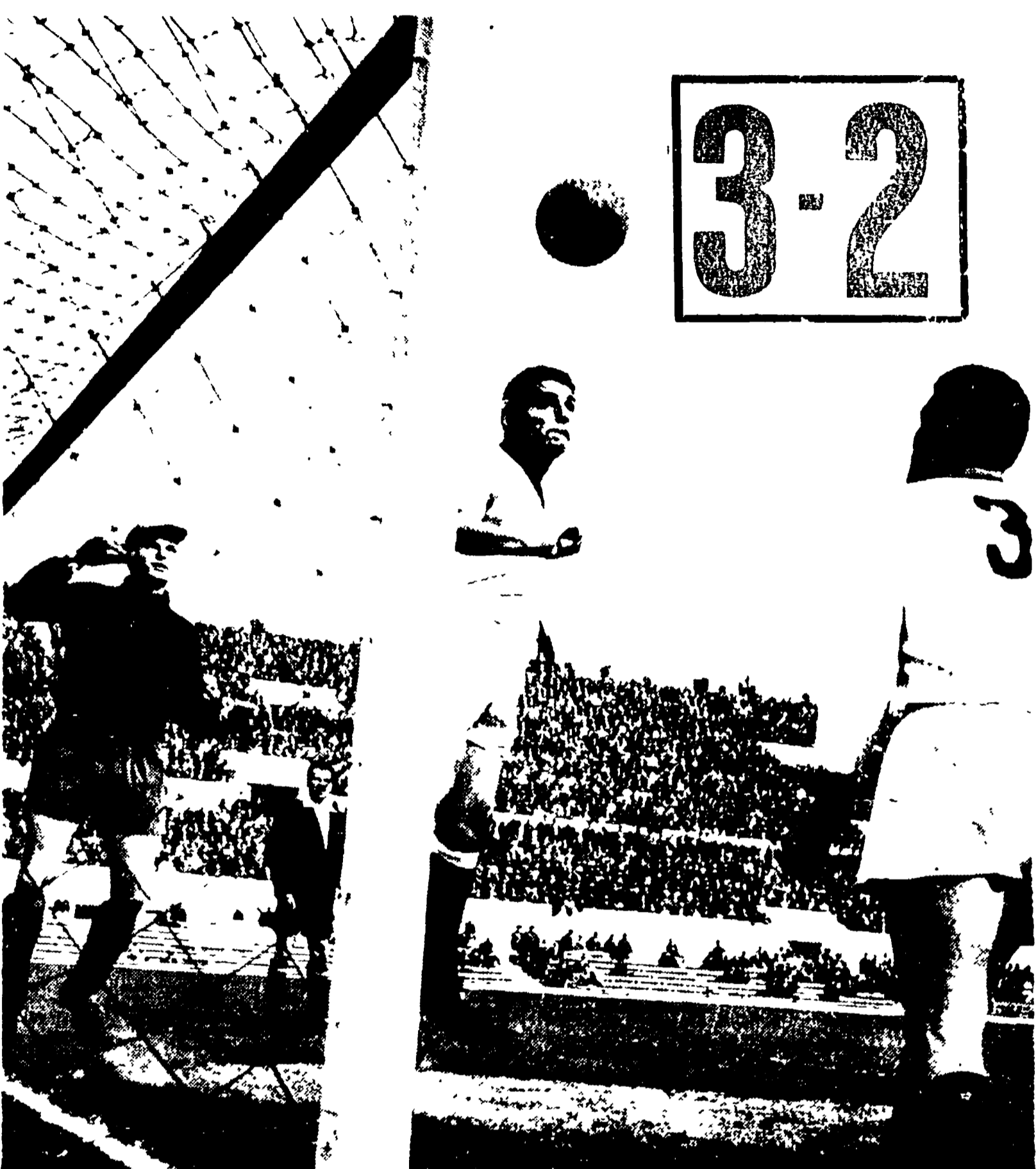
LAZIO-BARI 3-2 — Il salvataggio di MUPO sul colpo di testa di Tozzi al 1° di gioco

NUOVA SECCA SCONFITTA DEI GIALLOROSI PRIVI DI DAVID E GHIGGIA