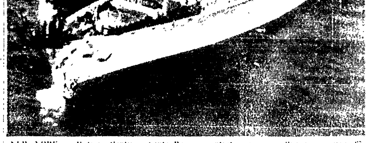
NEW YORK - Il transatlantico 'Santa Rosa' è entrato ieri in collisione a circa 65 miglia a sud di New York con la nave cisterna 'Valheim'. Un membro dell'equipaggio della 'Valheim', che è stata quasi spezzata per metà e morta e quattro sono rimasti feriti. Nella foto una veduta aerea della 'Santa Rosa' con la prua gravemente danneggiata. E' visibile il fumaiolo della petroliera incastato nella prua della nave.

Una dichiarazione del Partito comunista egiziano per libere elezioni nelle due regioni della RAU