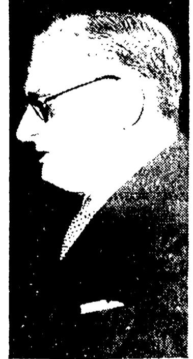
Il compagno Fausto Gullo

Milioni di contadini sono in attesa di un pesante carico fiscale e contributivo che riduce in modo pauroso i loro magri redditi di lavoro. Dopo le manifestazioni del 18 marzo i coltivatori diretti si apprestano a rinnovare la loro protesta chiedendo la diminuzione immediata di una certa parte delle tasse che ogni giorno e la sospensione degli illeggimi aumenti dei contributi per l'assistenza di malattia. La situazione è così grave che migliaia di contadini non hanno potuto pagare neppure la prima imposta scaduta il 18 febbraio. Su questa situazione e sull'azione che l'Alleanza ha sollecitato al Parlamento, abbiamo raccolto alcune domande al compagno Fausto Gullo, vice presidente del gruppo dei deputati del P.C.I.